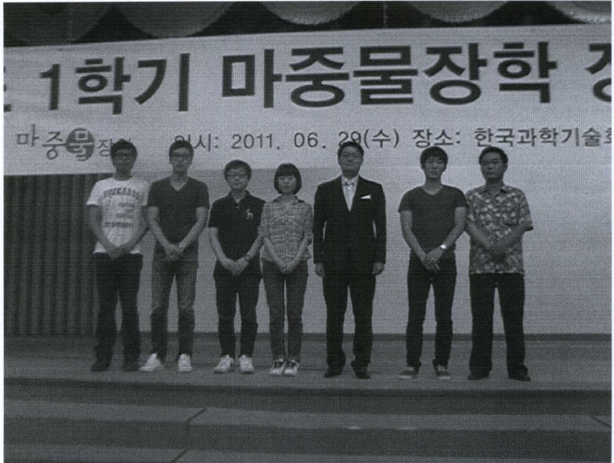
[2011.6.29, 1기 마중물 장학증서 수여식]